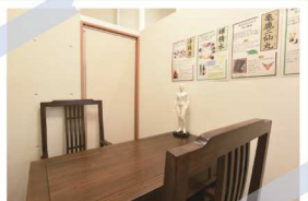
周りを気にせず、先生とご相談いただけます。