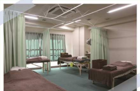
鍼やお灸、吸玉や電気治療など、その人に合った施術をしています。