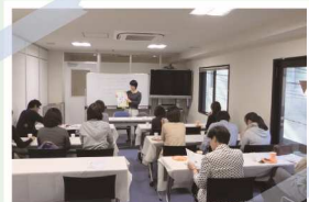
婦人科・ダイエットや美容のセミナーなどを開催しています。